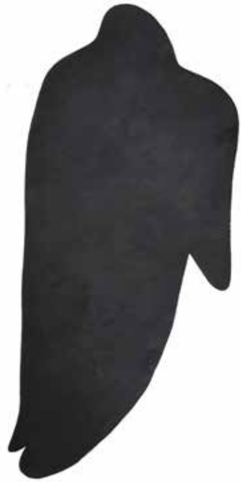
6 skulpturer, bränd plywood, ca 184x80 cm vardera 6 sculptures, burnt plywood, approx. 184x80cm each