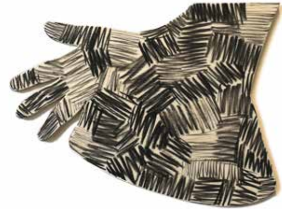
20 delar, kolkrita på plywood 20 pieces, charcoal on plywood

The title, Uro , is a Norwegian word, with a double meaning; it may be a suspended mobile/kinetic sculpture, but it is also a word for instability, unrest, or the feeling of concern and anxiety.