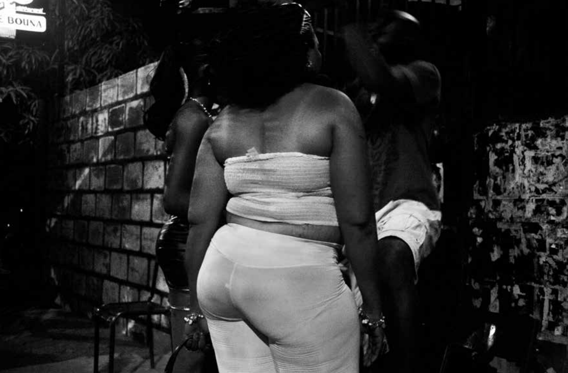
Le patapouf soirée de Tabaski espace Bouana Bamako 2012