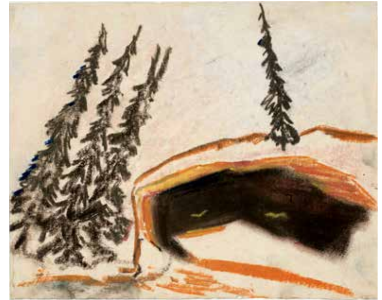
Olafur Eliasson, Your Windless Arrangement , 1997

Hill's work. No one wanted to listen to the desires of the subconscious or look at the expressive symbols; on the contrary, Hill's work was regarded as the prime symptom of his illness. Had he lived in a time with different norms, Hill's so-called symptoms of illness would perhaps not have been seen as signs of illness at all.