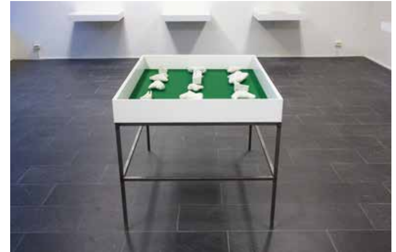
Anna Ling, Fossil och Polystyren , 2013

Lindblom’s Träd [Tree] was produced in the 1970s when a powerful environmental movement had emerged after the previous decades’ progressive optimism and rapid economic growth. The belief in the inexhaustibility of natural resources and nature’s boundless capacity to absorb pollution led to fear and concern about the increasing environmental pollution. A white branch has been tied with a rope onto a black wooden structure. The tree in its processed form – the wood of the structure – forms a body with the tree in its natural form, the branch. In Sivert Lindblom’s work nature is a construction, intimately connected to our culture and architecture where neither part can be separated from the other