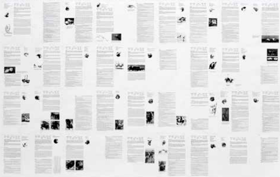
Henrik Olesen, Social organization and frequency of homosexual behavior among some species of animals , 2000