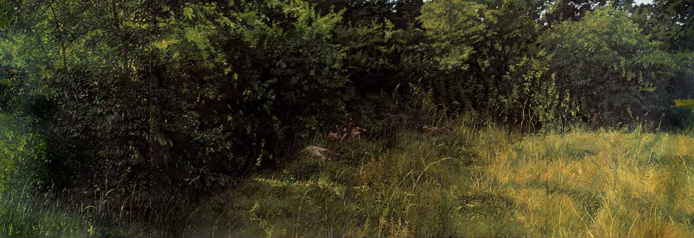
Gerhard Nordström, En utflykt i det gröna. Sommaren 1970 I-III, 1970