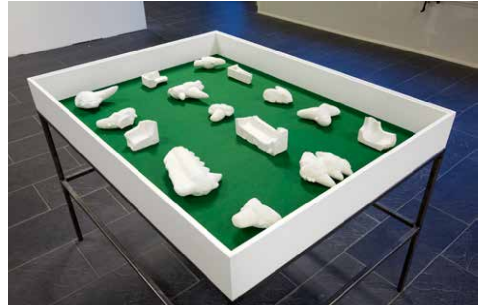
Anna Ling, Fossil och Polystyren , 2013