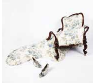
Nina Saunders, Blue Fjord , 2010

Nina Saunders transformerade smältande möbel är som en hallucination eller en yttre fysisk manifestation av en inre kollaps där det borgerligt välartade, blommiga tyget flödar ut över golvet. Nedanför ligger ett par skor i samma tyg, slarvigt slängda, som om någon i all hast hoppat ur dem på flykt genom det dystopiska och surrealistiska björklandskapet.