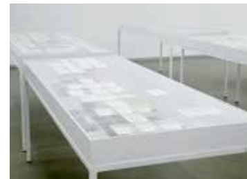
Kajsa Dahlberg, Någon oro förmärks inte, alla äro glada och vänliga/No Unease Can Be Noticed, All Are Happy And Friendly , 2010