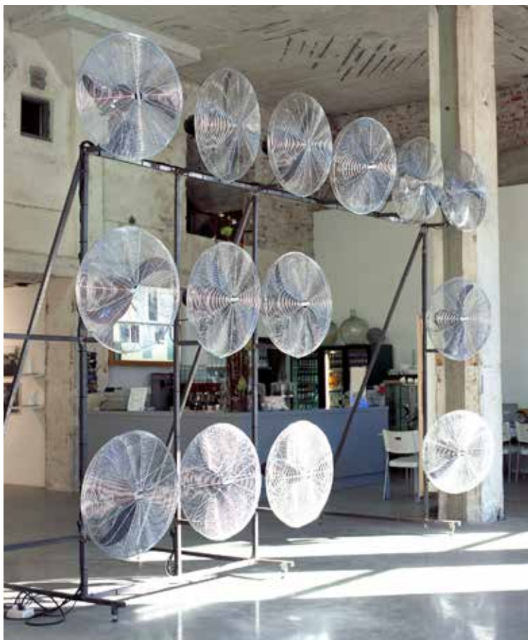
Olafur Eliasson, Your Windless Arrangement , 1997