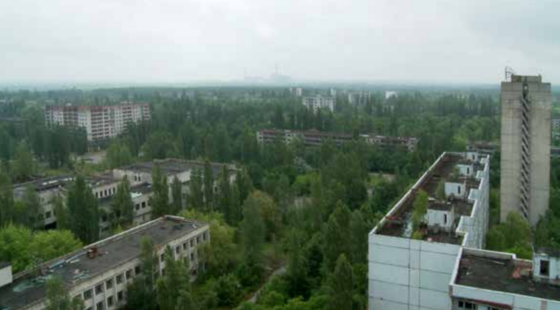
Lars-Andreas Tovey Kristiansen, The Radiant City , 2010