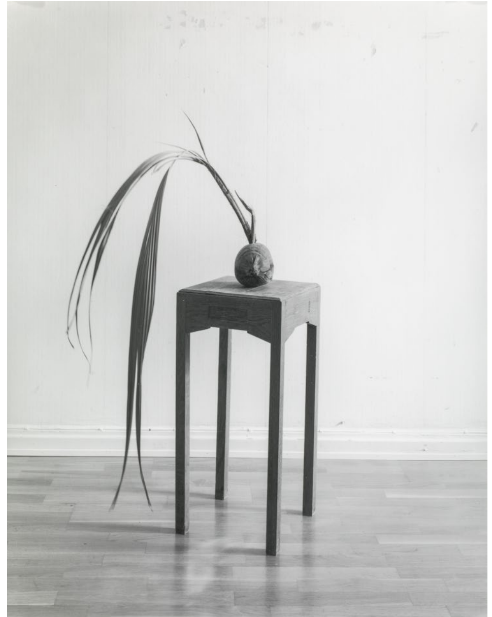
Maria Hedlund, Någon sorts kunskap #2 [Some kind of knowledge #2], 2014, gelatinsilverfotografi/gelatin silver print.