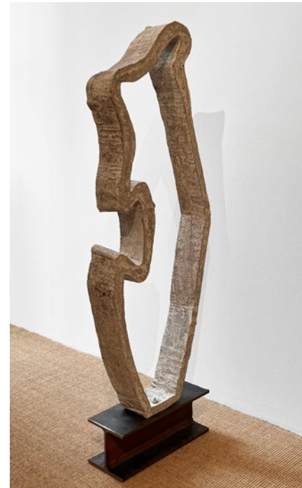
Philip Dufva, Intruders in a landscape II , 2024.

think share a similar approach to their artistic process. They express it in different ways and their practices differ, but there is a common point of entry that has to do with something essential to the function of art, what it actually does. It is this that the exhibition wants to emphasize, rather than a content-based theme.