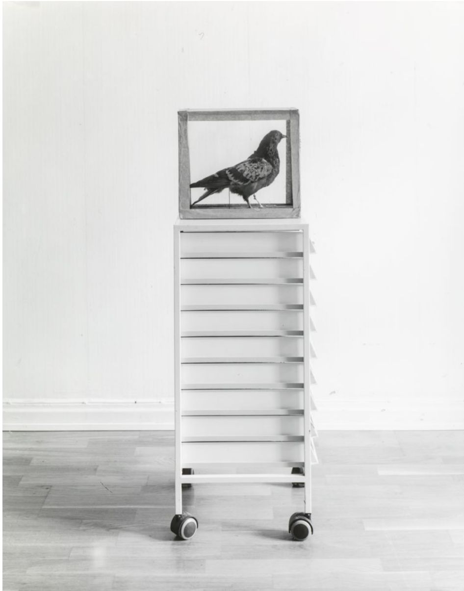
Maria Hedlund, Någon sorts kunskap #17 [Some kind of knowledge #17], 2014, gelatinsilverfotografi/gelatin silver print.