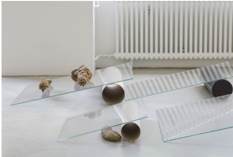
Eva Löfdahl, Uchronia's Seeds , 2018. Respite , installationsvy Galerie Nordenhake, Berlin, 2018.

Her works challenge our preconceptions, what we think we know, and consequently turn our habitual way of seeing upside down. This summer's group exhibition at Marabouparken konsthall – The Flow of Everything – gathers three artists from different generations that we